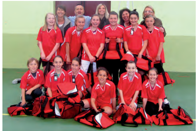
L'équipe des poussines